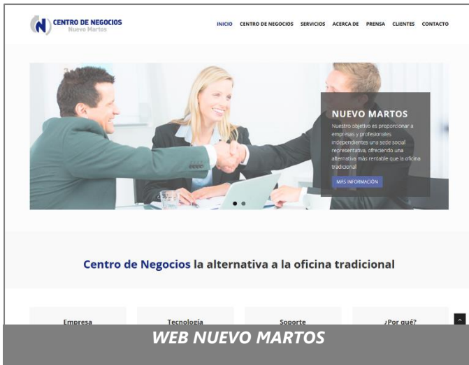
WEB NUEVO MARTOS