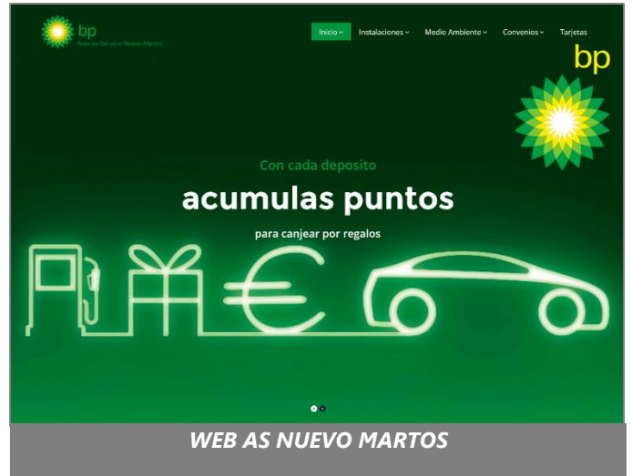
WEB AS NUEVO MARTOS